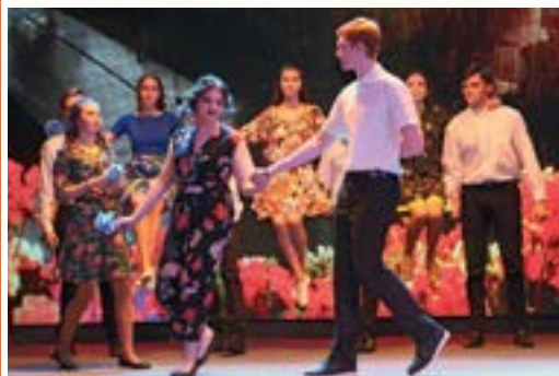
Самые очаровательные и любознательные