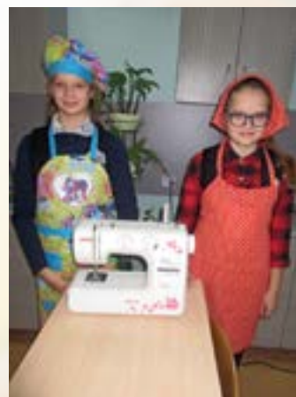
Юные портные ждут заказ