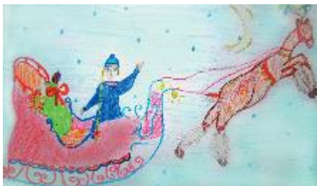
Рис. Александры Курбатовой, 4 «Б»