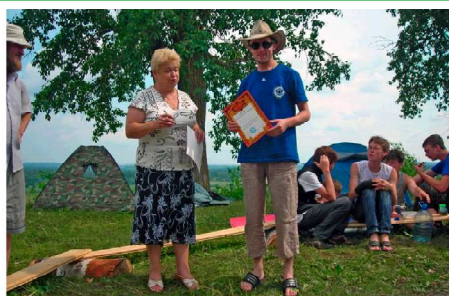
Награды героям субботника