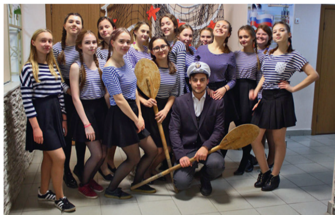
Осенний подарок педагогам от морячек