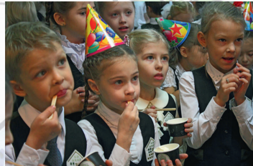
Мы – лицеисты! И очень счастливы!