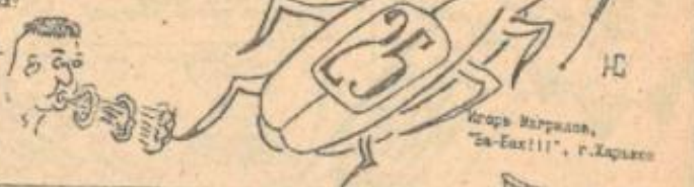
Горько Маршалов, "За-Бух!!!", г.Харкисе

Если вы отлучились в Гуртуде и будете искать от слухи, сидит автобус, то зайдите в кофейню напротив автовокзала. Закажите кофе, сидите за столиком возле стены и смотрите в тараканья беге. Сделайте так и вы не пожалеете. Я вам обещаю.