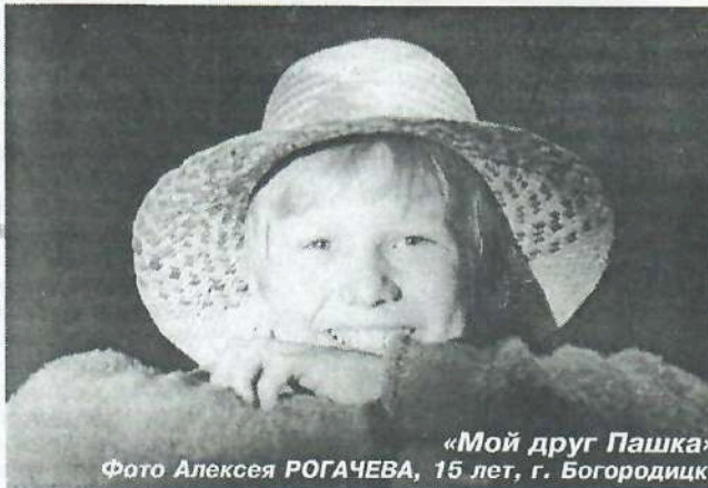
«Мой друг Пашка»