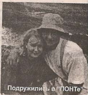
Подружились в "ПОНТе"