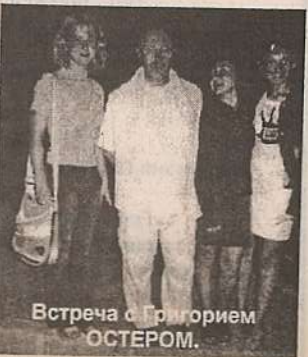
Встреча с Григорием Остером.