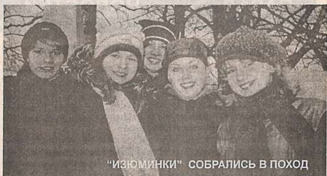
"ИЗЮМИНКИ" СОБРАЛИСЬ В ПОХОД