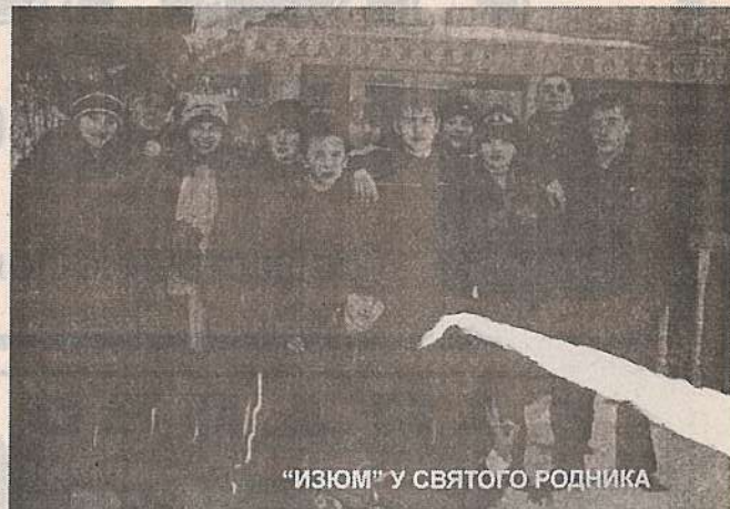
"ИЗЮМ" у СВЯТОГО РОДНИКА