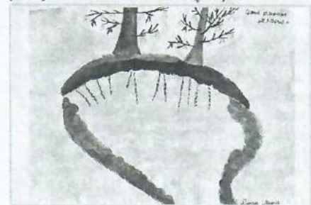
Святой источник «12 ключей».

Двенадцать ключей, с которыми народ связывает легенду о двенадцати богатырях, возвращавшихся с битвы и убитых рязанским отрядом, тоже обладает способностью исцелять раны и болезни. (До сих пор помнят об этом источнике люди и рассказывают своим детям. А дети рисуют святой источник).