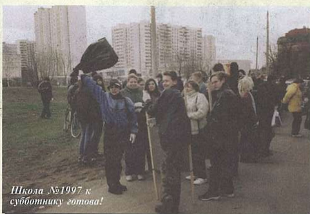
Школа №1997 к субботнику готова!

На «объект» - в парк Царицыно – школьников вывозили двумя партиями. Первые автобусы отъехали от управы района уже в 8 часов 20 минут, вторую группу ребят должны были увезти на час позже. Мне вместе с одноклассниками посчастливилось оказаться во второй партии, поэтому мы больше выс-