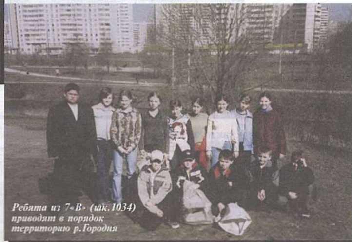
Ребята из 7-В (шк.1034) приводят в порядок территорию р.Городня