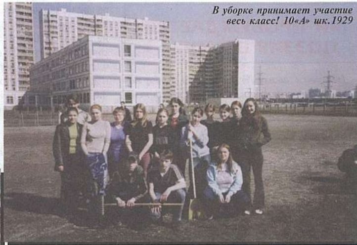
В уборке принимает участие весь класс! 10«А» шк.1929

Не думаю, что стоит рассказывать о том, как проходил сам субботник, ведь это многолетняя традиция, которая почти не изменяется. Я пришла домой около 14 часов, уставшая, перемазанная с ног до головы чер-