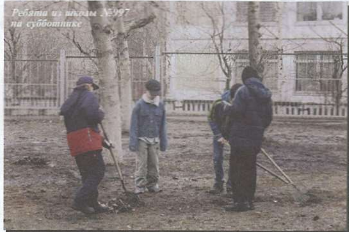
Ребята из школы № 1997 на субботнике