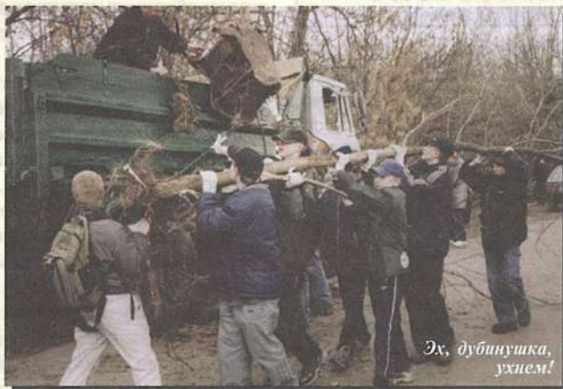
Эх, дубинушка, ухнем!

Увлечшись уборкой, наши мальчишки и учителя-мужчины в азарте начали выносить и выволакивать из леса мусор покрупнее: