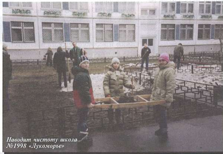
Наводит чистоту школа №1998 «Лукоморье»

Наступили весенние солнечные выходные. Уже тепло, можно сменить сапоги на кроссовки, а пальто – на плащ или легкую спортивную куртку.