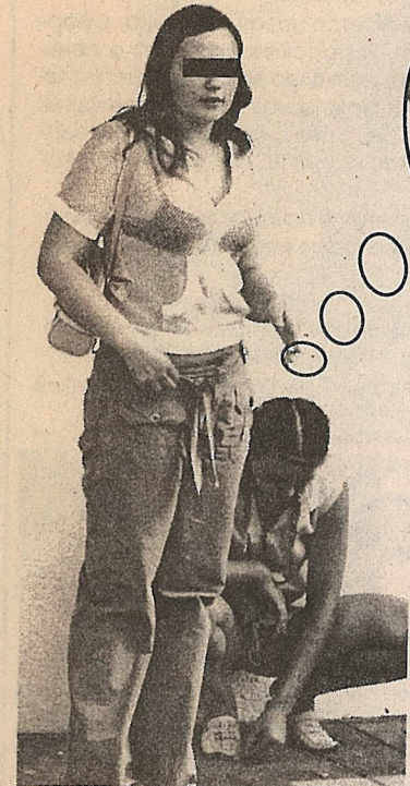
День. Позади здания детского лагеря «Стремительный». Девочки курят. Фотография сделана участником смены.