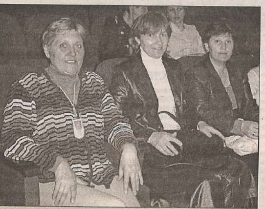
Во время поездки на спектакль в Театр Драмы. 2006 г.

«Спасение утопающих» - дело рук самих утопающих» - главный девиз членов клуба. Вот и «спа-