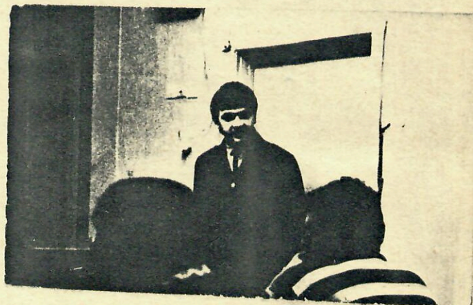
Фоторепортаж " Спять опаздывает этот Горбач!"