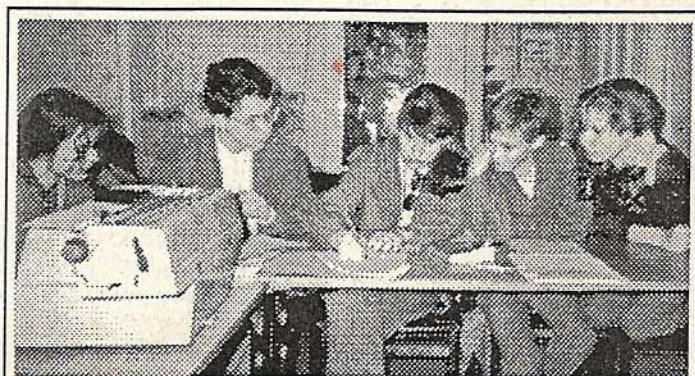
Ради нескольких строчек в газете...