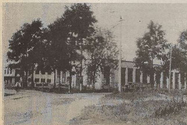
На снимке: мастерские лица.

Вот и кончился второй год учебы в ПТУ № 20, теперь — в ВПУ-лицее. Я учусь, как мне кажется, в лучшей группе в мире, у нее и номер — 1. Говорят из нас электромонтеров с водительскими правами категорий В и С.