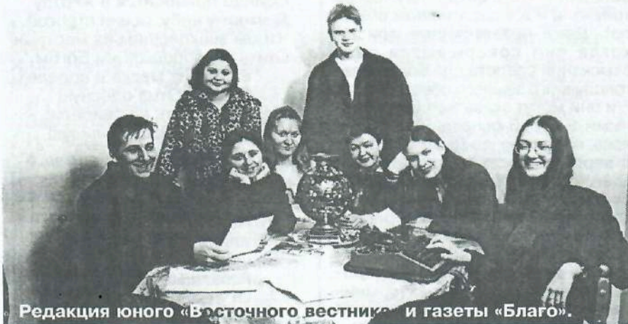
Редакция юного «Восточного вестника» и газеты «Благо».

– Мы верим в духовное возрождение молодежи. И стараемся помогать ему. Потому мы рады сотрудничеству с молодежной газетой, рады, что юные дарования полюбили бывать на богослужении в церкви и с охотой занимаются в творческих кружках.