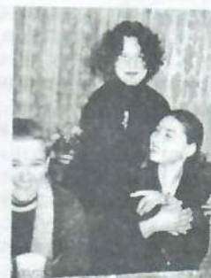
Молодые поэтессы из «Яслей»

Безумие – страстно Разыскивать счастье Взметая дорожную грязь. Мир создан неверно! Но завтра же первым Сорвусь, над собой смеясь.