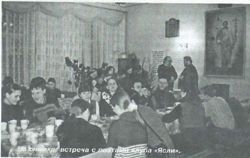
На снимке: встреча с поэтами клуба «Ясли».

Где со мною рыдают дожди, И мечтает заря наяву. О, не рви этих бус, подожди! Я еще на земле поживу... Слезы рос задрожат на ветру Сквозь его нарастающий вой... Знаешь, я никогда не умру, – А в лучи окунусь с головой.