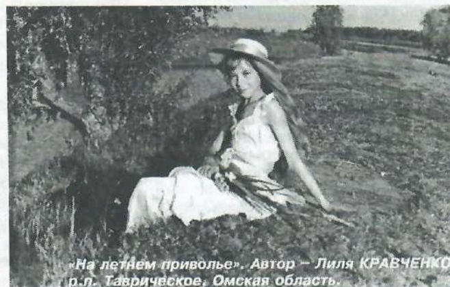
«На летнем приволье». Автор – Лиля КРАВЧЕНКО, р.п. Таврическое, Омская область.