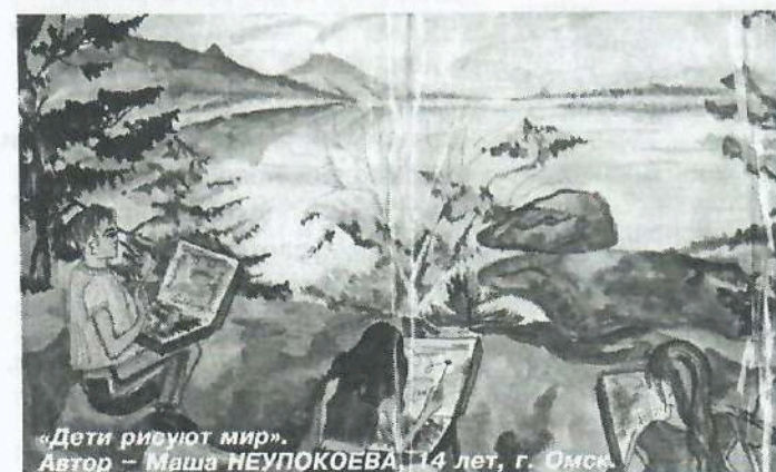
«Дети ривуют мир». Автор – Маша НЕУПОКОЕВА, 14 лет, г. Омск.