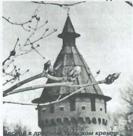
Весной в древнем Тульском кремле