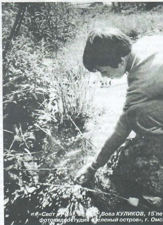
«Светлая». Автор – Вова КУЛИКОВ, 15 лет, фотостудия «Белый остров», г. Омск.