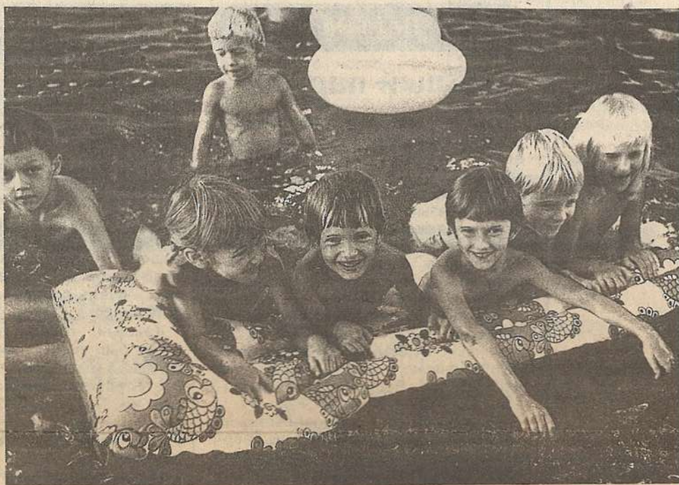
Пусть солнце не было щедрым для нас, но лето — все-таки лето!