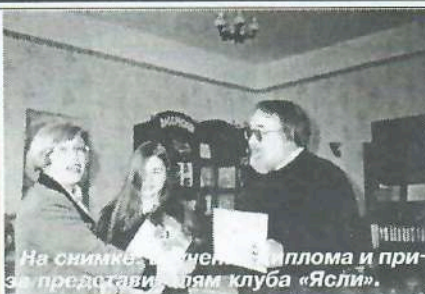
На снимке – вручение диплома и приза представителем клуба «Ясли».