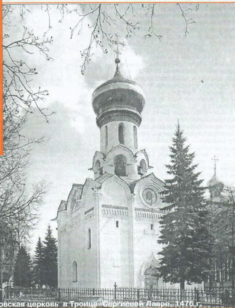
Духовская церковь в Троице-Сергиевой Лавре, 1476 г.

Великое событие сошествия Св. Духа на апостолов богословы называют «днем рождения Церкви Христовой». Просвещенные Духом Святым, апостолы мужественно и безбоязненно с великим дерзновением начали проповедь о Христе Распятом и Воскресшем из мертвых, и Церковь Христова начала расти и множиться.