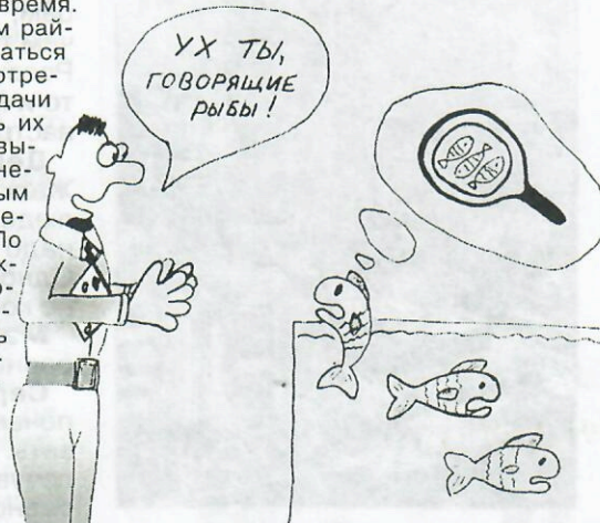
Рис. О. ПАНКОВОЙ