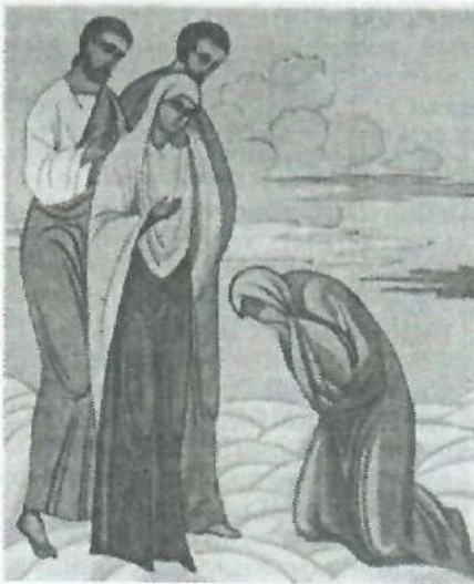
Встреча матери и детей на Страшном Суде Христовом.