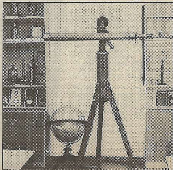
Кабинет физики. Это наша история.