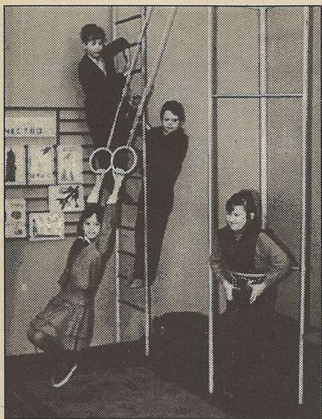
А на перемене делай — что хочешь! З "А" отдыхает в классе.