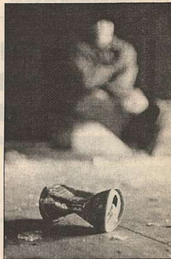
Начался XXI век - лекарство от СПИДа не найдено, но надежда... Сколько можно надеяться - надо действовать, решить самому, что важнее: безопасный секс или ... А что «или», - выбор за вами.

Помимо фотовыставки были сняты три видео ролика «Возьми с собой!». Но самое замечательное, на мой взгляд, это то, что в «Свалке» и других московских клубах также проходит акция «Возьми с собой!»: раздаются презервативы, артисты делятся своим мнением о безопасном сексе, проходят специальные конкурсы - в общем, всё на высшем уровне. Очень удачный ход - использовать для агитации популярных певцов, ведь ни для кого не секрет, что современная молодёжь во всем старается копировать своих кумиров.