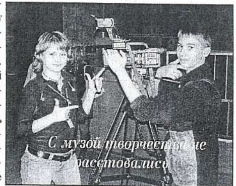
С музой творчества не расставайся

Помочь Музе достичь вас может сдв. Особенно в дни фестиваля, когда ее так не хва-