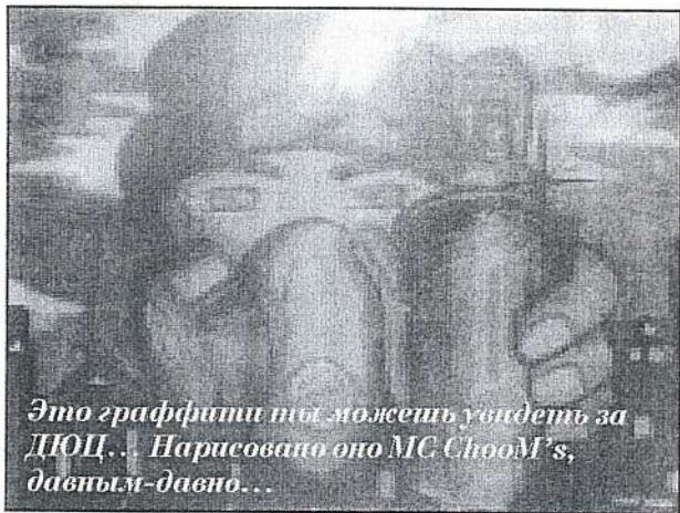
Это граффити ты можешь увидеть за ДЮЦ... Нарисовано оно MC ShoOM's, давным-давно...