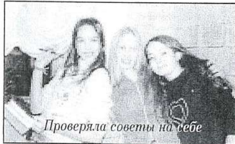
Проверяла советы на себе

Фестиваль, фестиваль... Сколько событий, впечатлений! Сколько практики для журналиста с любым стажем работы. Именно на фестивале самое время показать все свои способности и умения. Но что делать, если вдохновение уходит именно в тот момент, когда оно больше всего необходимо. Наверное, эта проблема актуальна для каждого журналиста. Надемся несколько «Воробьиных» советов помогут тебе