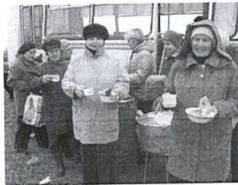
Неодними знаниями сыг учитель