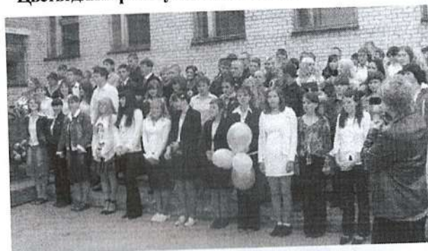
Вот они наши выпускники