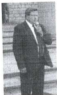
Мы начинаем учебный год