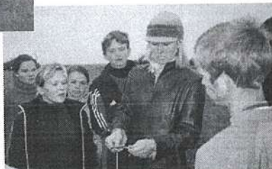
"бабский узел" не для ботинок