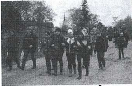
А это шагают наши гости - ребята из Холмова. Идут первыми, наверное знают дорогу. Интересно, откуда?