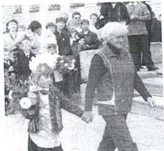
С самой не так страшно