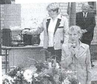
В этом году нас ждёт аттестация и нужно учиться в полную силу