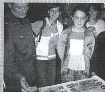
на "Главный" по дорожным знакам