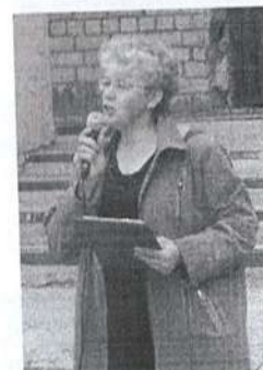
Дипломы тем, кто летом не только отдыхал, но и трудился