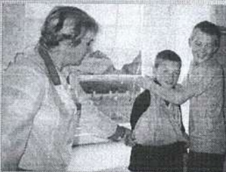
Без знаний медицины никуда