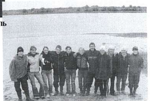
А это победители - команда 10а класса