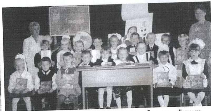
Вот он - первый класс, с азбуками и пока слобными пятёрками. Удачи вам, ребята!