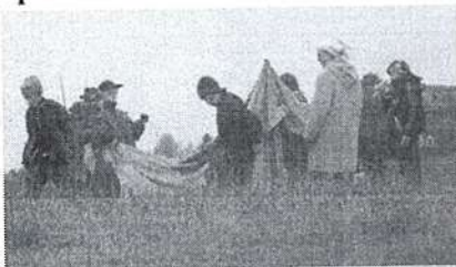
Вместо кольшек пришлось держать палатку самим. Неужели и в походе будет так же?

21 сентября после трёх коротких уроков, выслушав последние наставления, мы всей школой организованно отправились на турслёт. Несколько человек контролировали движение на дороге и обеспечивали нашу безопасность. Красиво раскинулось наше озеро Ерилово по бескрайнему лугу. Здесь и решено было устроить игру - и места много, и дом родной видно. На линейке прошли представления отрядов, причём влившиеся в организацию "Вертикаль" одиннадцатиклассники никак не могли представить свой отряд - толи волновались, толи ещё что. Но мы так и не поняли они "Деды" или "Хиты". Были на игре и гости - сборная лидеров из Холмовской школы под руководством Л.А.Сухановой и О.А.Матвеевой.