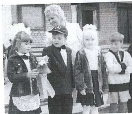
...и все остальные первоклассники