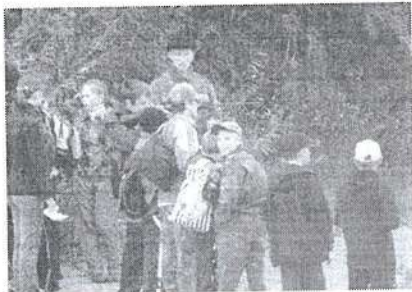
- Дай я буду стрелять. - Нет, отойди, я сам. Ну вот из-за тебя промазал