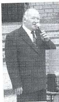
Я желаю вам успехов и хороших оценок