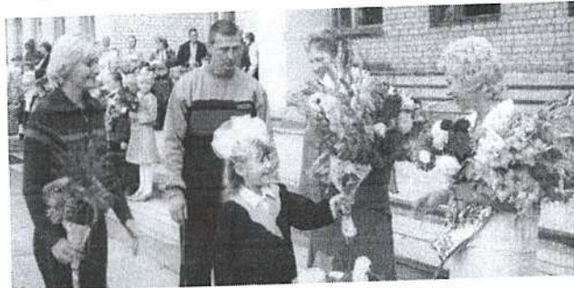
Цветы для первого учителя и воспитателя