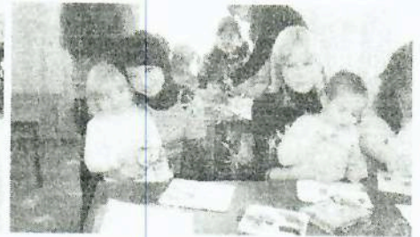
газета для детей и подростков