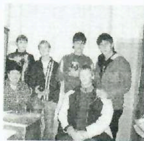
Актив клуба «Инфинити»