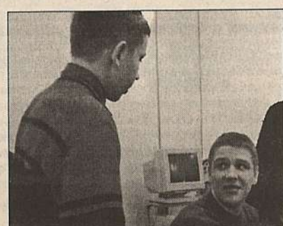
7. Старший брат отмахивается: «Да отвали ты, нет у меня денег, НЕТУ!!!». Все-таки удастся выпросить десятку.