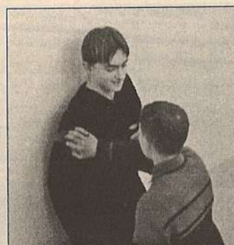
9. Ну-ка, пацан, гони бабки! Ты мне должен!