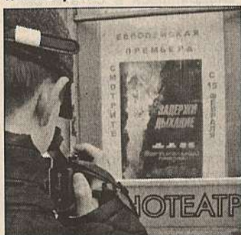
2. ... рекламу американского фильма, который давно мечтал посмотреть.