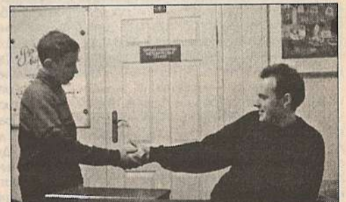
5. Иду к отцу, тот денег дает, но очень мало.