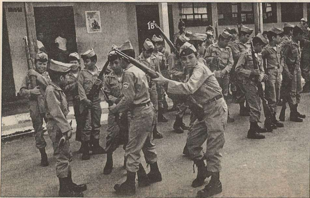
На фото: С оружием умеют управляться и дети в Гватемале.

ООН обезоружила 2500 юных суданских повстанцев