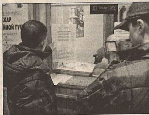
3. Захожу в кассу. Думаю: «Сейчас билет куплю».