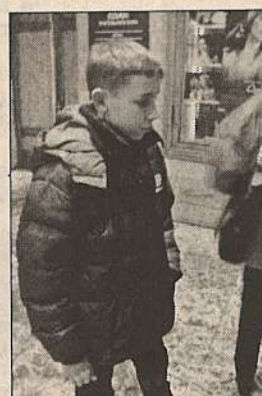
8. Где можно еще взять денег на кино?