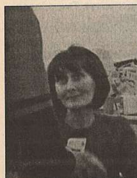
6. Мама и того меньше.