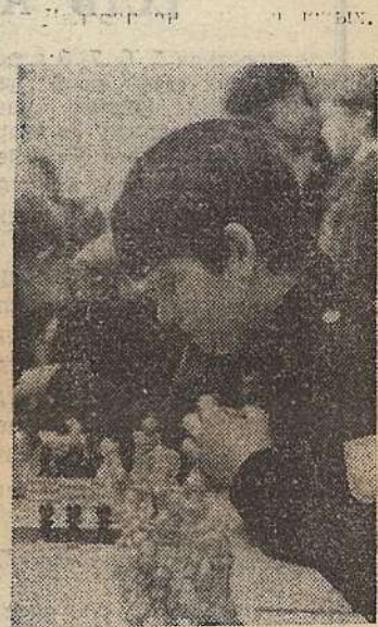
В клубе шахматистов.