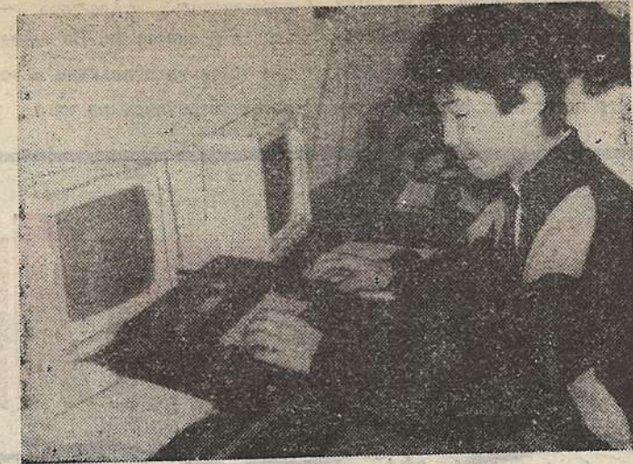
«В компьютерном классе».

Девочки и мальчики в возрасте от 11 до 15 лет входят в состав харцерских отрядов. Парни носят форму цвета хаки, а девочки — серого цвета. На левом рукаве находится эмблема с гербом города или региона, на погонах — номер отряда. У каждого отряда свой цвет галстука. Значком харцеров является харцерский крест, который носят под левым