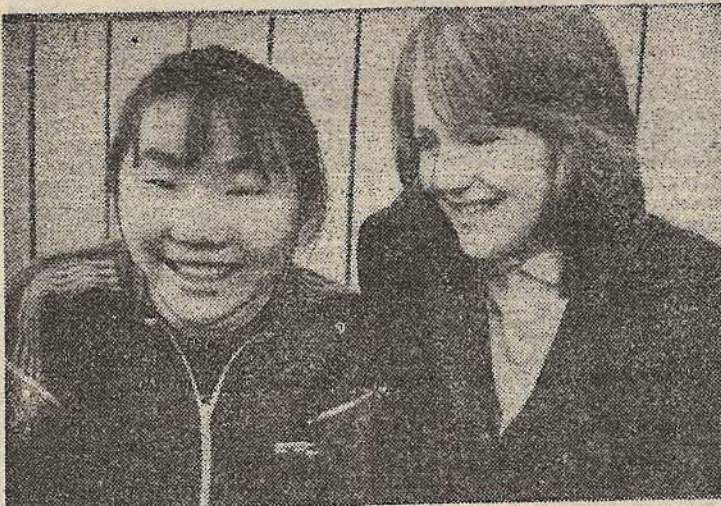
Фото и текст И. АЛЕКСЕЕВОЙ.

Ыныччан, Усть-Майский район, VII «А» класс.