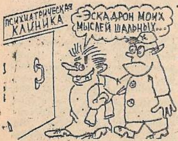
Рис. В. Жабского.