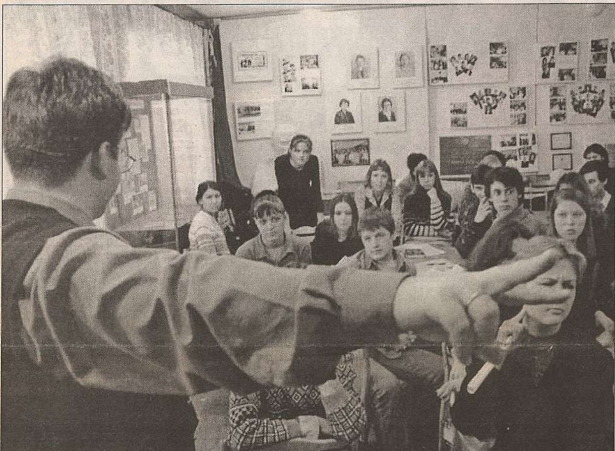
Результаты соцопроса читайте на стр. 2.

«Юношеская газета» провела социологический опрос о том, что думают подростки о Правительстве