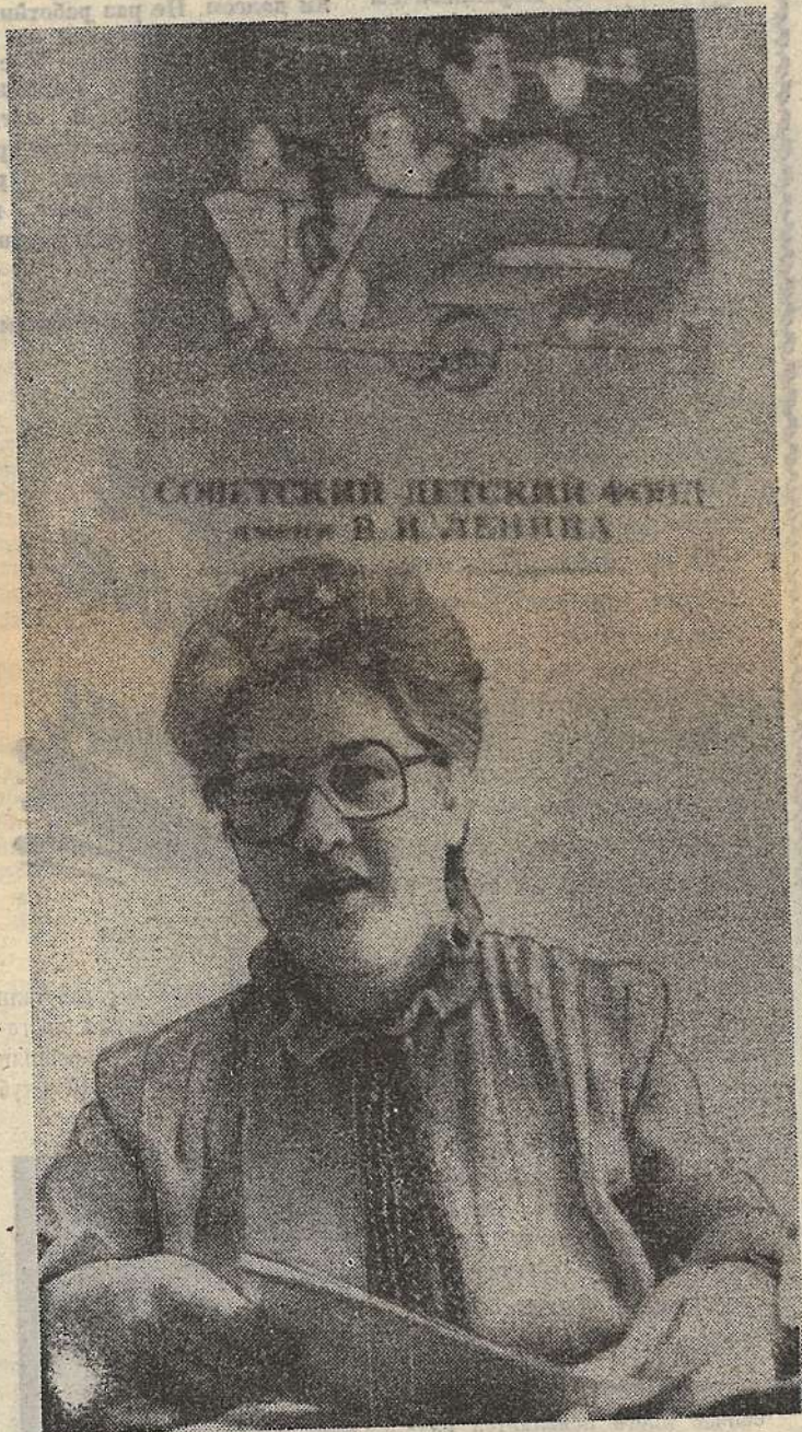
СОЦИАЛИСТИЧЕСКИЙ ДЕТСКИЙ ФОНД имени В. И. ЛЕНИНА