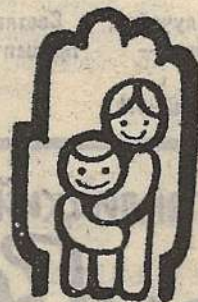
п. Звездочка, Усть-Майский район.