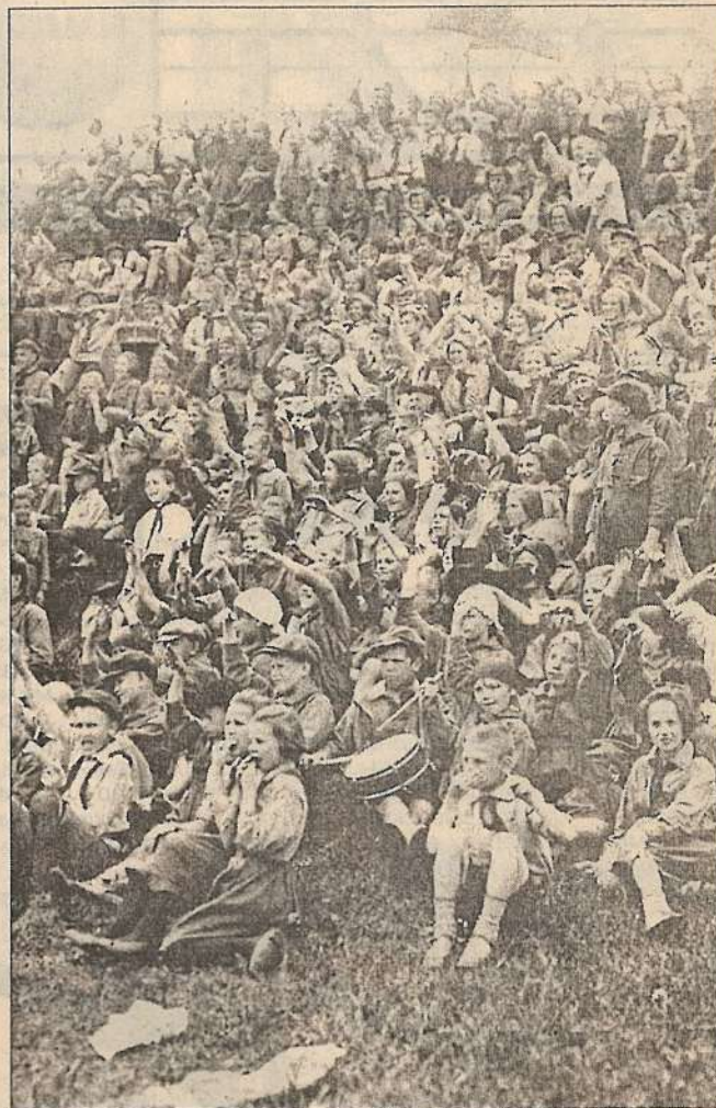
1929 год