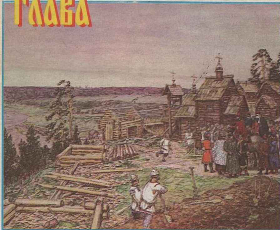
«Основание Москвы. Постройка первых стен Кремля Юрием Долгоруким». Репродукция с картины А. М. Васнецова.

Предком русских князей считается новгородский князь Рюрик. Он — «ствол» дерева. Его многочисленные потомки — их называют «рюриковичами» — княжили во всех русских землях и городах, которые они сами часто и ставили, то есть строили. Рюрикови-