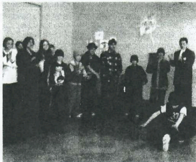
выступление творческой мастерской «Брей-Денц»