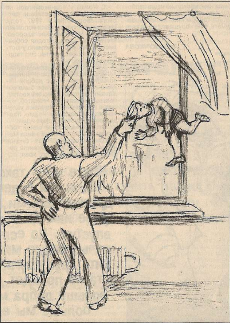
Рисунок Ани ФИЛИПОВОЙ