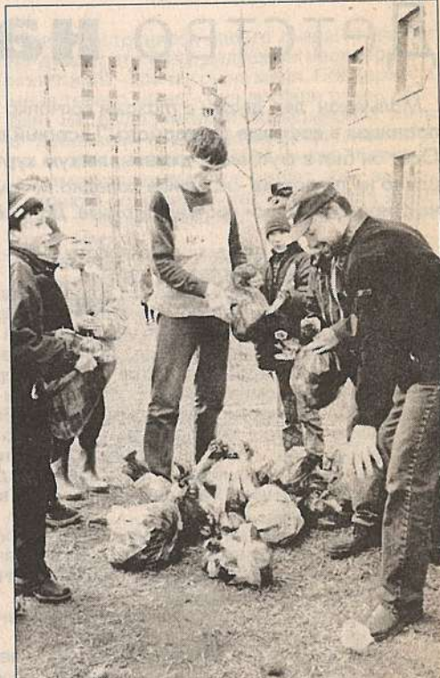
На фото: слева - около игрового автобуса сразу же собрались ребята из ближайших домов; справа - через несколько минут на этом месте вырастет огромная куча из мусорных пакетов и состоится их торжественное сожжение. Жить надо в чистоте!