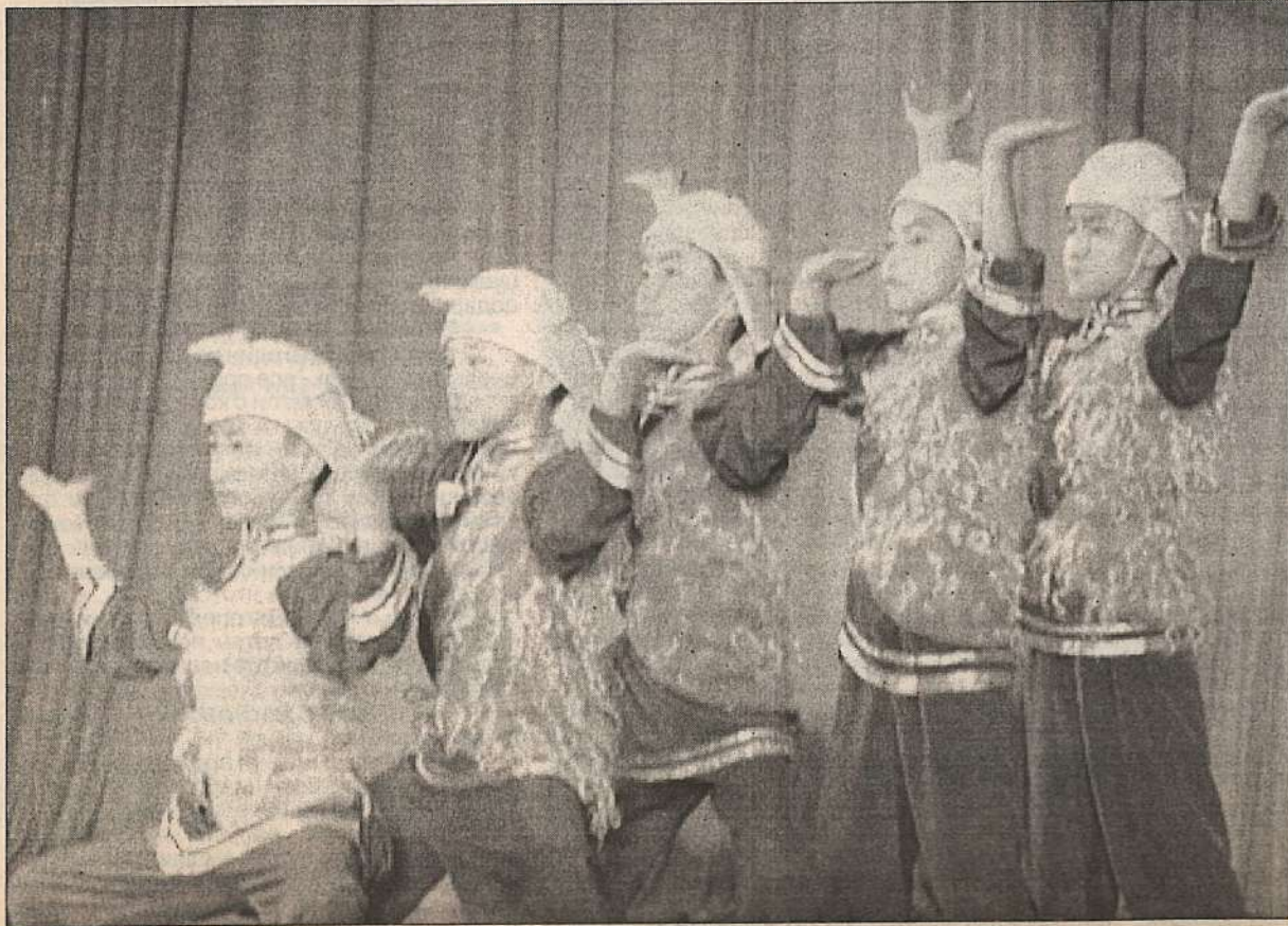
Ансамбль народного танца «Эдегей» (г. Кызыл) Гран-при фестиваля «Роза ветров»

Международный фестиваль-конкурс детского и юношеского творчества «РОЗА ВЕТРОВ» проводится для детских, юношеских любительских и профессиональных вокальных и хореографических коллективов, для художников, композиторов, поэтов, сценаристов, журналистов России и зарубежных стран.