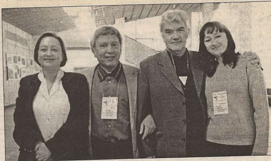
Члены жюри фестиваля