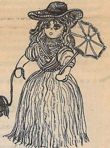
Дама с собачкой

У каждого человека свои экзамены. Были они и у наших выпускников. Я имею в виду ребят из Детской школы искусств. Главными были, конечно, большие и красочные работы по композиции, но не остались без внимания и изделия декоративно-прикладного характера.