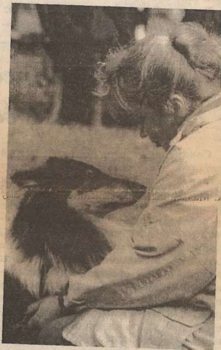
Спаниель Лана на руках у новой хозяйки

Но самое увлекательное было преподнесено на десерт — костюмированное шоу. Не растерялись и ребята из воинской части, надев на своего коллегу-овчарку форму. Собаки в костюмах превращались в пиратов, бойцов, металлистов, леди в бальном платье... А самый маленький участник шоу — сиамский котенок — был в костюмчике, связанном для девочки — его хозяйки, когда она была совсем крошкой. Все участники получили призы и дипломы,