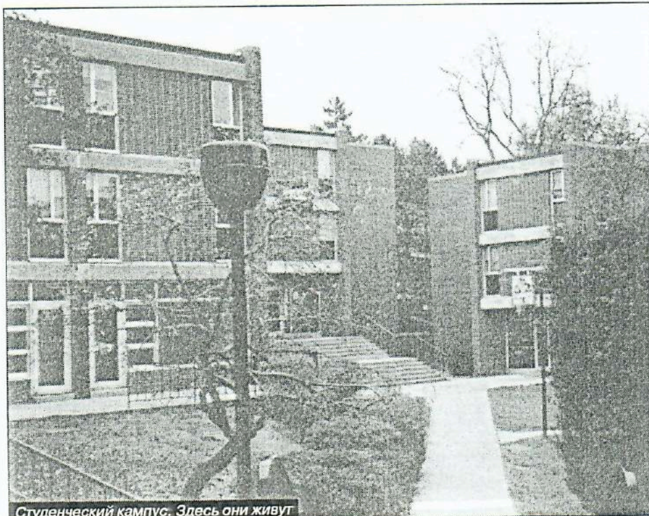
Студенческий кампус. Здесь они живут