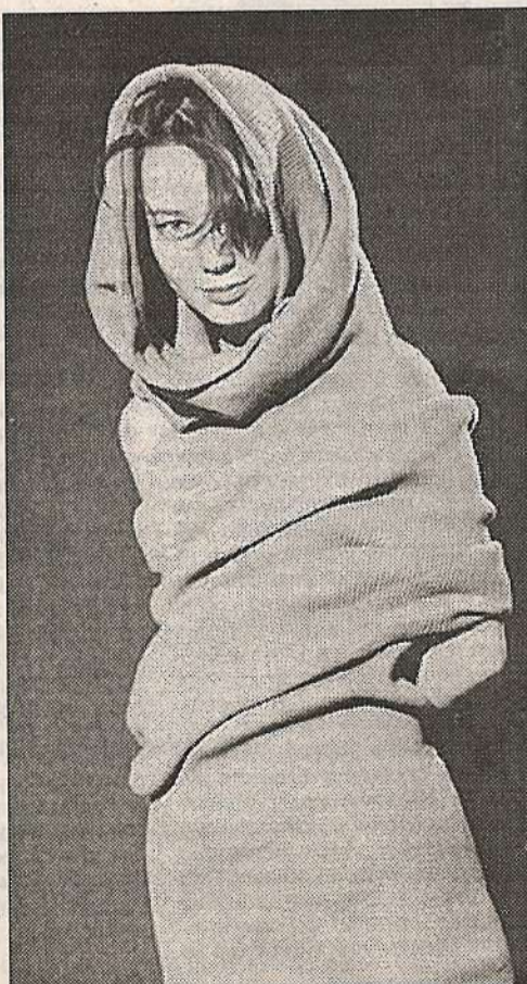
А такая форма вам нравится?