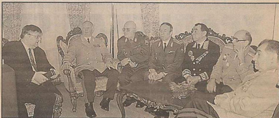
«У камина» - День защитника Отечества – традиционный сбор генеральского клуба Уральского землячества в Представительстве Губернатора Э.Э. Росселя

Ярким событием в жизни землячества стало участие в концертах Уральского академического филармонического оркестра (главный дирижер и художественный руководитель Дмитрий Лисс) 20—21 мая 2002 года. Впервые многие из уральцев-москвичей познакомились с замечательным искусством певицы Ольги Бородиной – солистки Мариинского театра, примадонны Метрополитен Опера, Ла Скала, Ковент Гарден, постоянной участницы Зальцбургского фестиваля, и пианиста Бориса Березовского, лауреата Конкурса им. П.И. Чайковского. Чувство гордости за мастерство артистов и солистов пе-