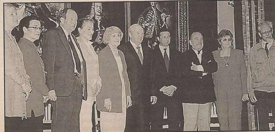
Потомки рода Демидовых и губернатор Эдуард Россель сделали «семейную» фотографию на память

память о прошлом, но и опыт, полезный для будущего. Участники обсуждали «точки роста» российской экономики: высокотехнологичные сектора экономики, снижение издержек производства, повышение конкурентоспособности выпускаемой продукции, улучшение инвестиционного климата, развитие интеграции территорий.