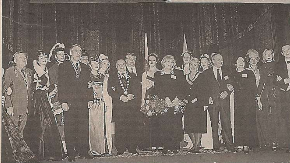
Кавалеры Демидовских наград среди участников и гостей V (Московской) Ассамблеи Международного Демидовского фонда

Правительство Москвы Комитет общественных и межрегиональных связей