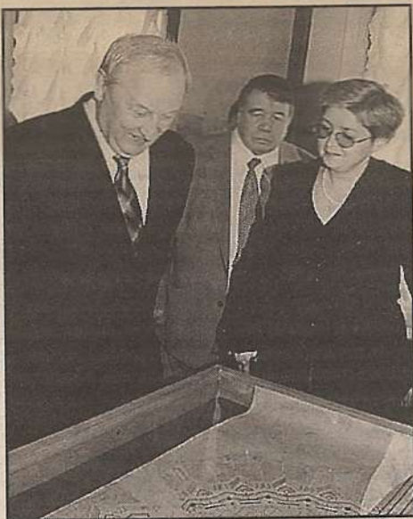
В залах дворца была открыта выставка Санкт-Петербургского архива РАН, впервые представившая публике собрание документов демидовской династии

«Три столетия — не только юбилейная дата в биографии удивительного города на Неве, — сказал губернатор Эдуард Россель при открытии Ассамблеи. — Это и трехвековая веха созидательного партнерства Каменного пояса России с ее северной столицей».