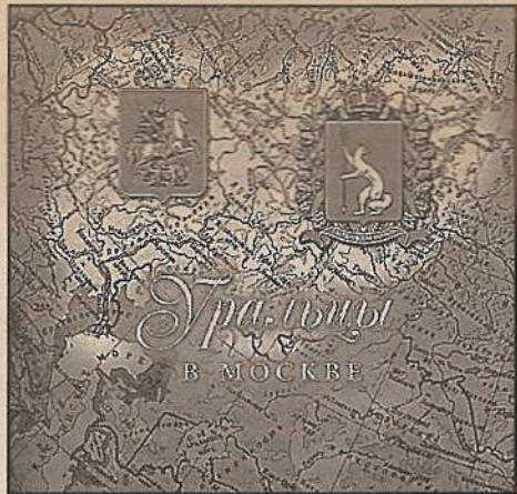
Обложка сборника «Уральцы в Москве»

Интересует буквально все: что происходит на работе, дома, на досуге, вообще в вашей жизни. Ваши материалы появятся в «Областной газете». Особая просьба к ру-