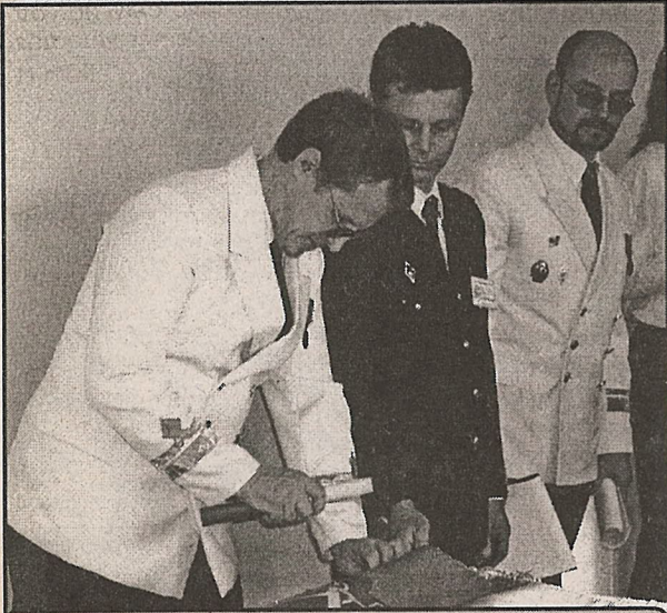
Первый гвоздь на знамя Сбора юных моряков России «Гардемарины, вперед!» забивает первый человек корабля «Штормовой»