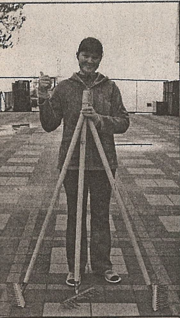
Так все начиналось...