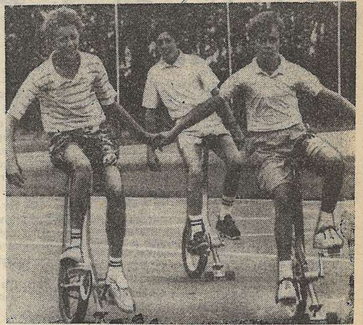
Такой гибрид велосипеда с роликами очень нравится ребятам.