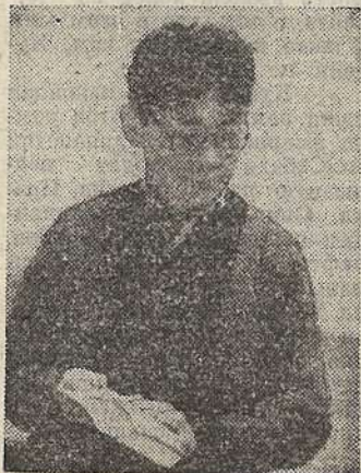
Полосу подготовили: Е. ЯКОВЛЕВА.