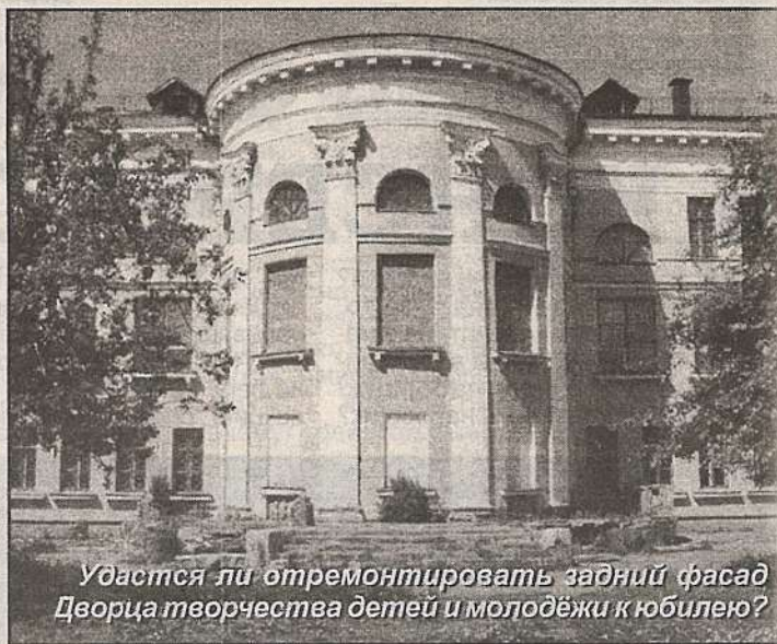
Удастся ли отремонтировать задний фасад Дворца творчества детей и молодежи к юбилею?