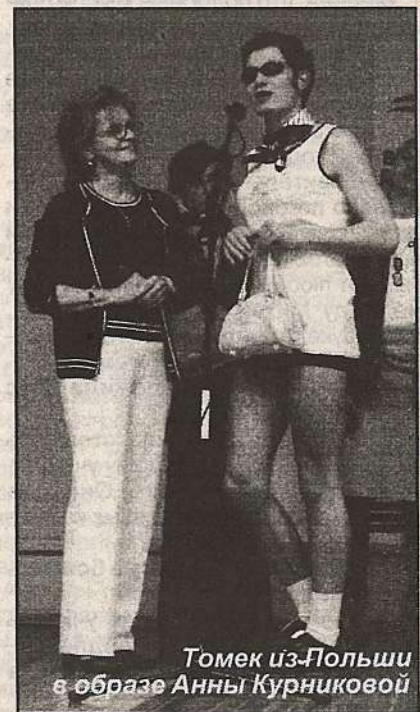
Томек из Польши в образе Анны Курниковой

Шупашкар (чув.) - Чебоксары, столица Чувашии Ачипачи (чув.) - детский Ай-Данек (кирг.) - лунное зернышко