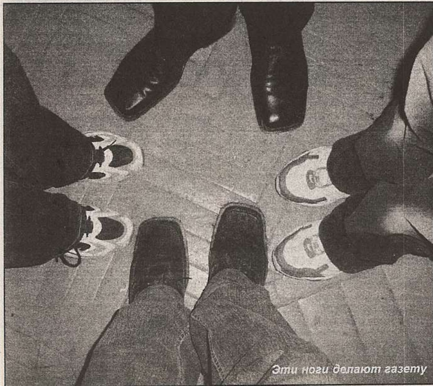
Эти ноги делают газету