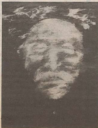
брые глаза животного и чистый деревенский снег.