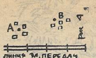
Линия М. ПЕРЕДАЧ

Как нужно провести к ним электролинию, чтобы суммарная длина линии была наименьшей?