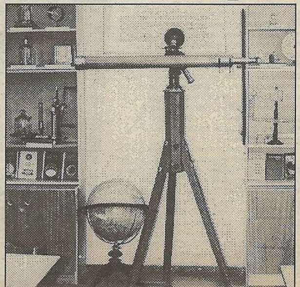
Кабинет физики. Это наша история.