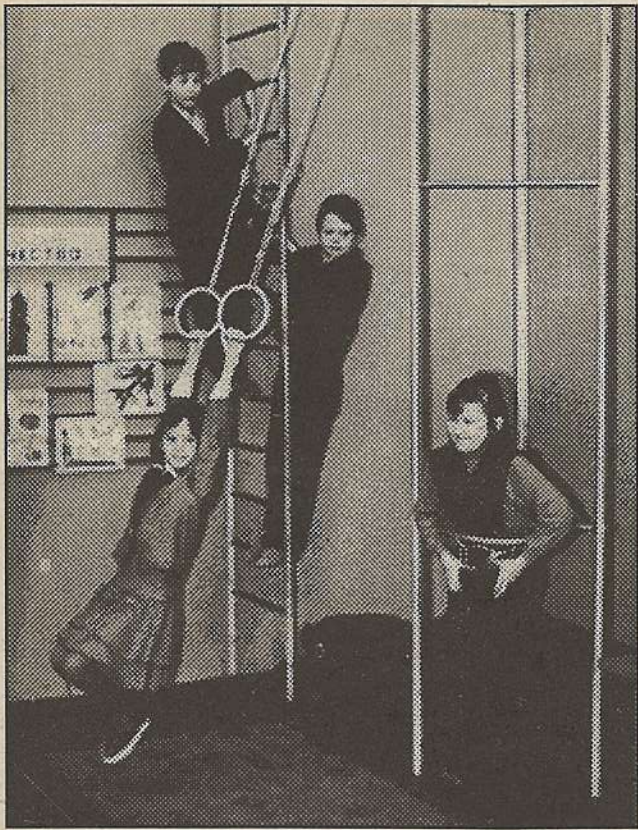
А на перемене делай — что хочешь! З "А" отдыхает в классе.